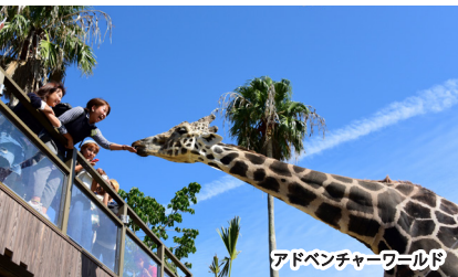
アドベンチャーワールド