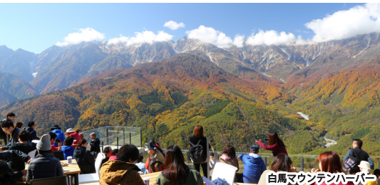
白馬マウンテンハーバー

コートヤード・バイ・マリオット 白馬 TEL 0261-75-5489 www.laforet.co.jp/lf-cyh