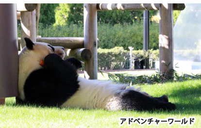
アドベンチャーワールド

人気のジャイアントパンダをはじめ、人とイルカが共演するマリンライブなどで1日中楽しめる アドベンチャーワールド。秋のおすすめは、動物たちの世界をより近く感じられる 「ウォーキングサファリ」。ご自身のペースでサファリワールドをお楽しみいただけます。